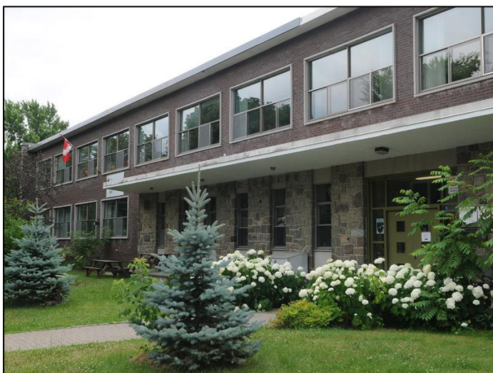
École Beau-Séjour, édifice Nord